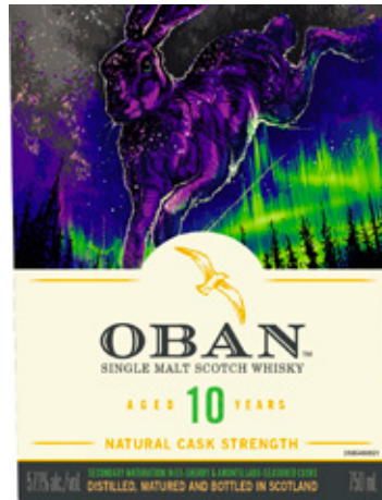
Oban – aged 10 years

Nachgereift in ex-Sherry & Amontillado-Seasoned Fässern, abgefüllt mit 57,1 Vol%.