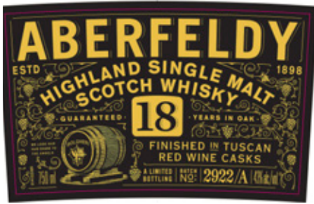
Aberfeldy aged 18 years - Tuscan