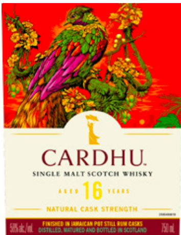
Cardhu – aged 16 years

Am 08.04.2022 tauchten sieben Etiketten zu den Special Releases 2022 von Diageo auf. Erfahrungsgemäß muss das noch nicht die komplette Reihe sein, da häufig der Name eines „Überraschkandidaten“ erst kurz vor der Markteinführung der Reihe bekannt wird.