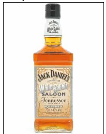
Produkte (u.a.): Jack Daniel's Gentleman Jack Jack Daniel's No.7 Jack Danile's Single Barrel Jack Daniel's Tennessee Honey

280 Lynchburg Highway Lynchburg, TN 37352 www.jackdaniels.com