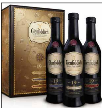
Madeira Cask Finish

Glenfiddich Age of Discovery im Reisebereich auch als Geschenkpackung an mit je 20 cl der Sorten: