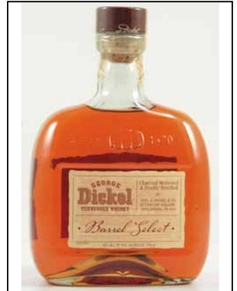
George Dickel No.12 George Dickel Barrel Select George Dickel Whisky wird ohne @ geschrieben!

George Dickel Cascade Hollow George Dickel No. 8